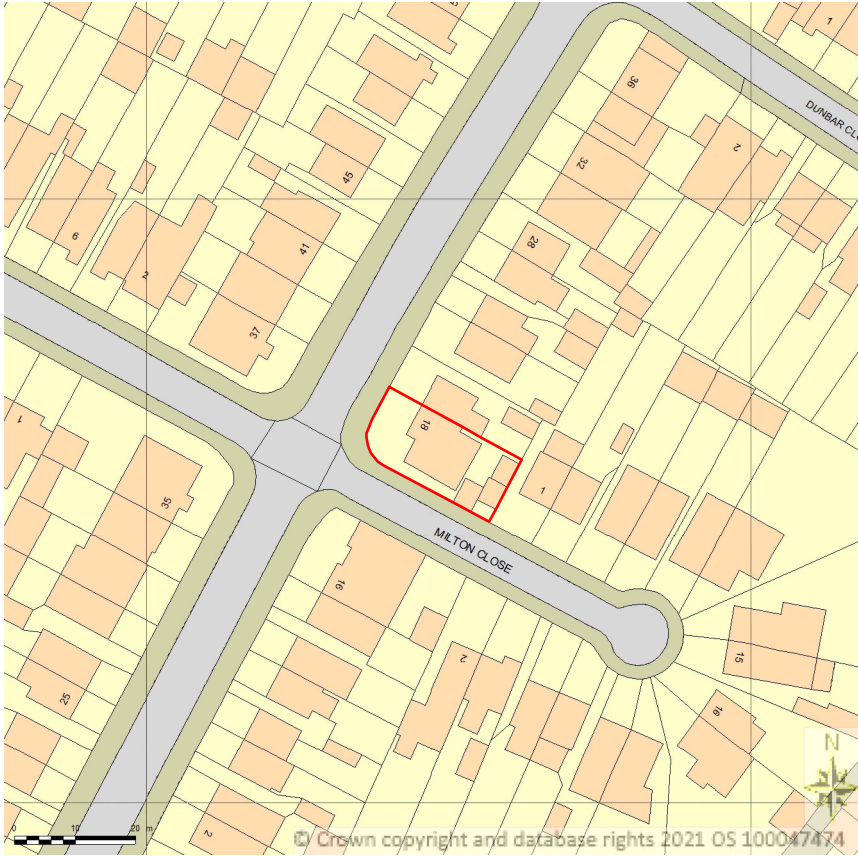
Location Plan @ 1:1250