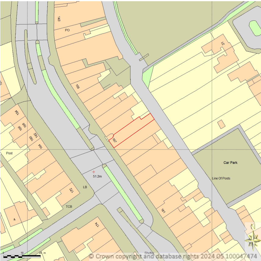
Location Plan @ 1:1250